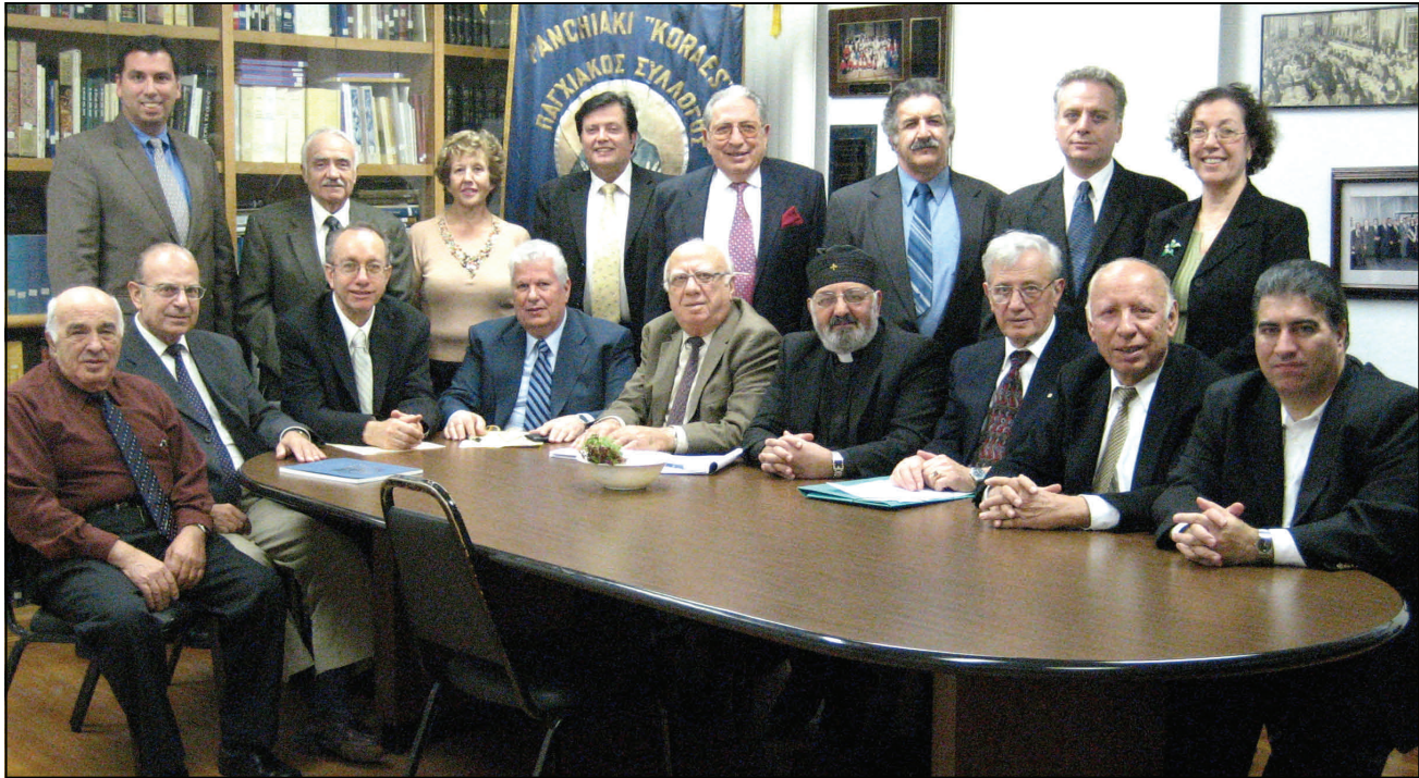
Το νέο Διοικητικό Συμβούλιο του Παγκιακού Συλλόγου «Κοραΐς» της Νέας Υόρκης μετά τον αγιασμό στη συνεδρίαση την Τρίτη 27 Νοεμβρίου 2007