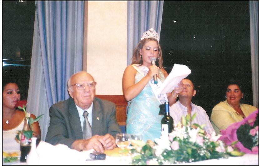
Στιγμιότυπο από την ομιλία της Μις Χίος 2007, στην τιμητική βραδιά που διοργανώθηκε στο ξενοδοχείο Χανδρής στις 20 Αυγούστου 2007

Προσωπικά από την εκλογή μου και μετά έθεσα σαν στόχο να συγκεντρώσω χρήματα και να βοηθήσω τα άτομα με ειδικές ανάγκες του νησιού μας. Ο στόχος μου πραγματοποιήθηκε και απόψε με πολλή υπερηφάνεια και συγκίνηση έχω μια επιταγή με $7000 που θα δοθεί για τα παιδιά με ειδικές ανάγκες και άλλη