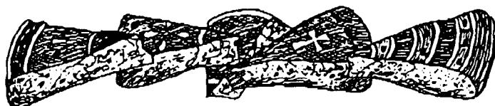
The cutting of the Vassilopita